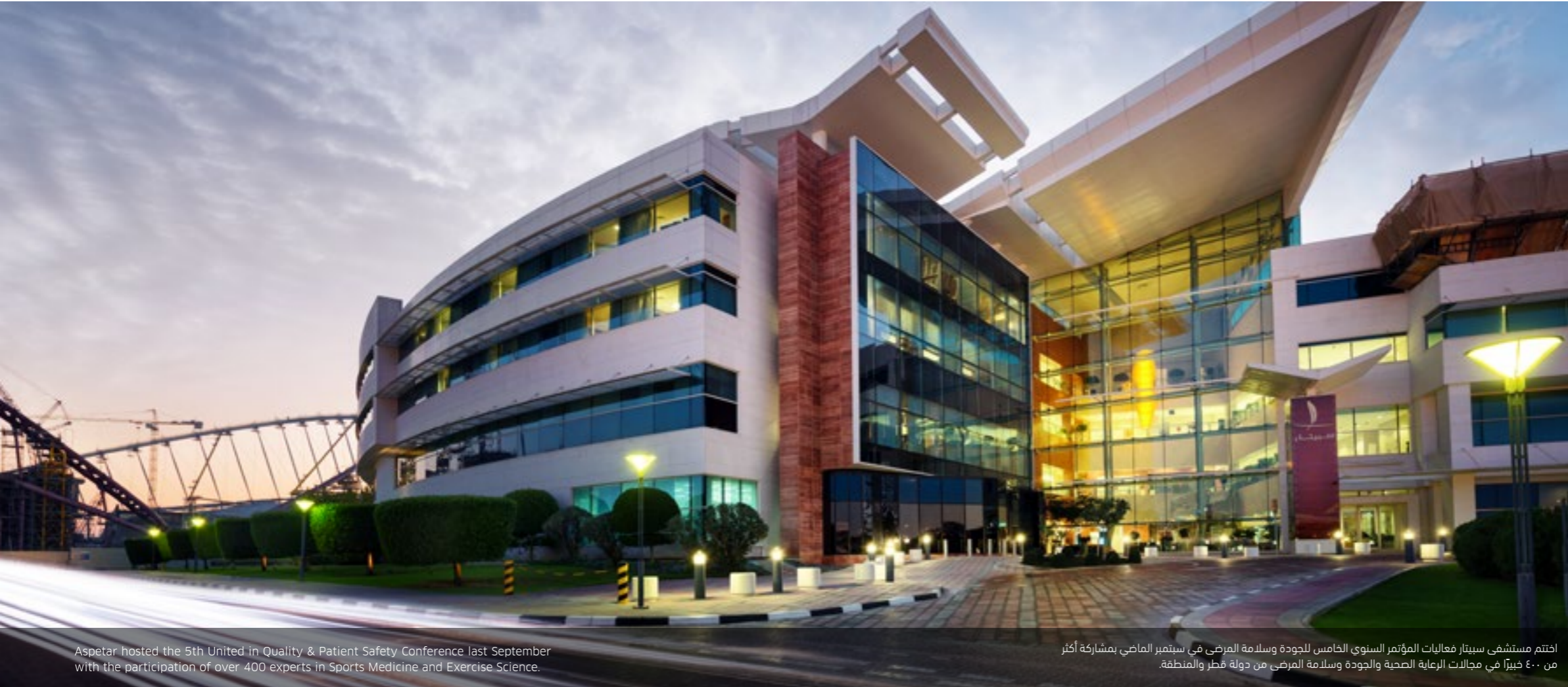
Aspetar hosted the 5th United in Quality & Patient Safety Conference last September with the participation of over 400 experts in Sports Medicine and Exercise Science.