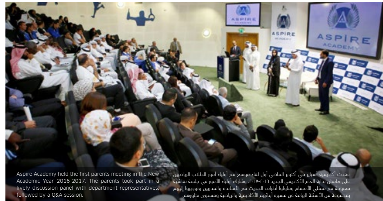
Aspire Academy held the first parents meeting in the New Academic Year 2016-2017. The parents took part in a lively discussion panel with department representatives, followed by a Q&A session.