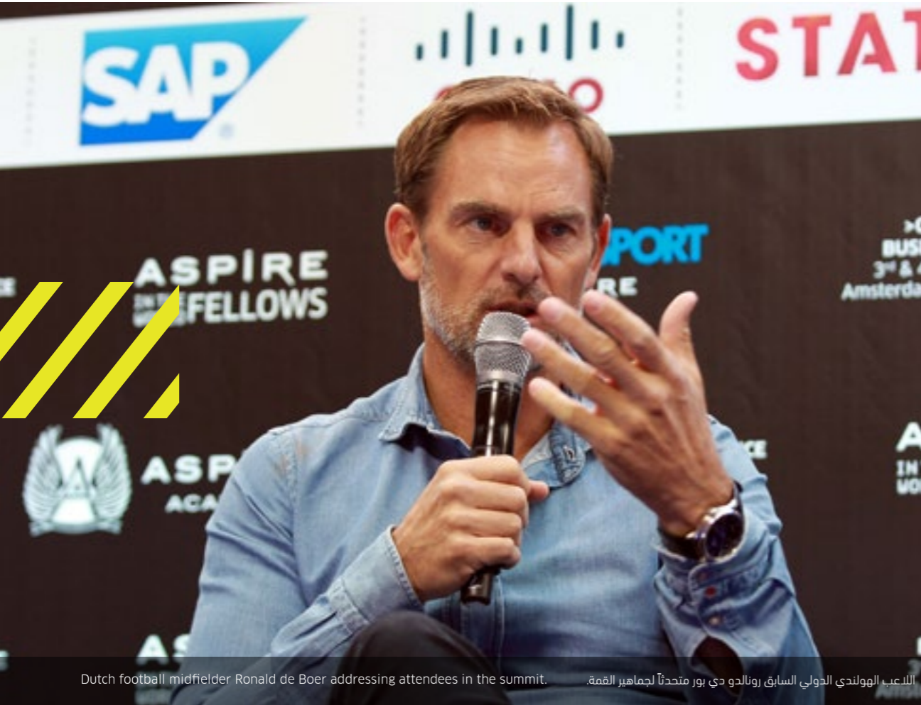
اللاعب الهولندي الدولي السابق رونالدو دي بور متحدثاً لجمهور القمة. Dutch football midfielder Ronald de Boer addressing attendees in the summit.