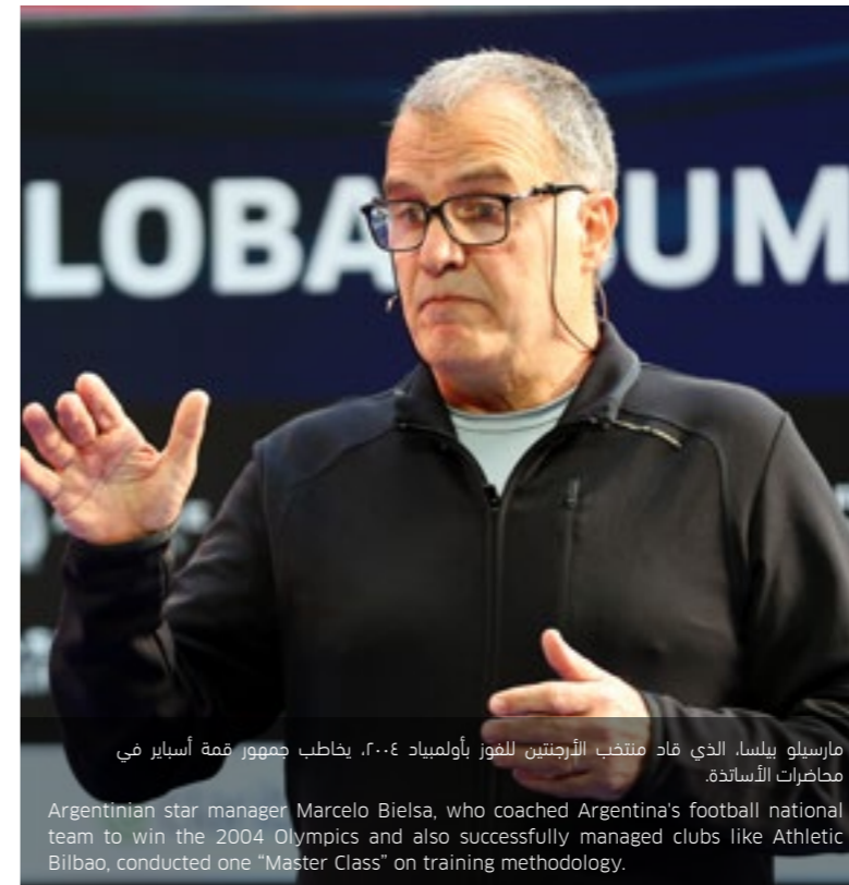
مارسيلو بيلسا، الذي قاد منتخب الأرجنتين للفوز بأولمبياد ٢٠٠٤، يخاطب جمهور قمة أسباير في محاضرات الأساتذة. Argentinian star manager Marcelo Bielsa, who coached Argentina's football national team to win the 2004 Olympics and also successfully managed clubs like Athletic Bilbao, conducted one "Master Class" on training methodology.