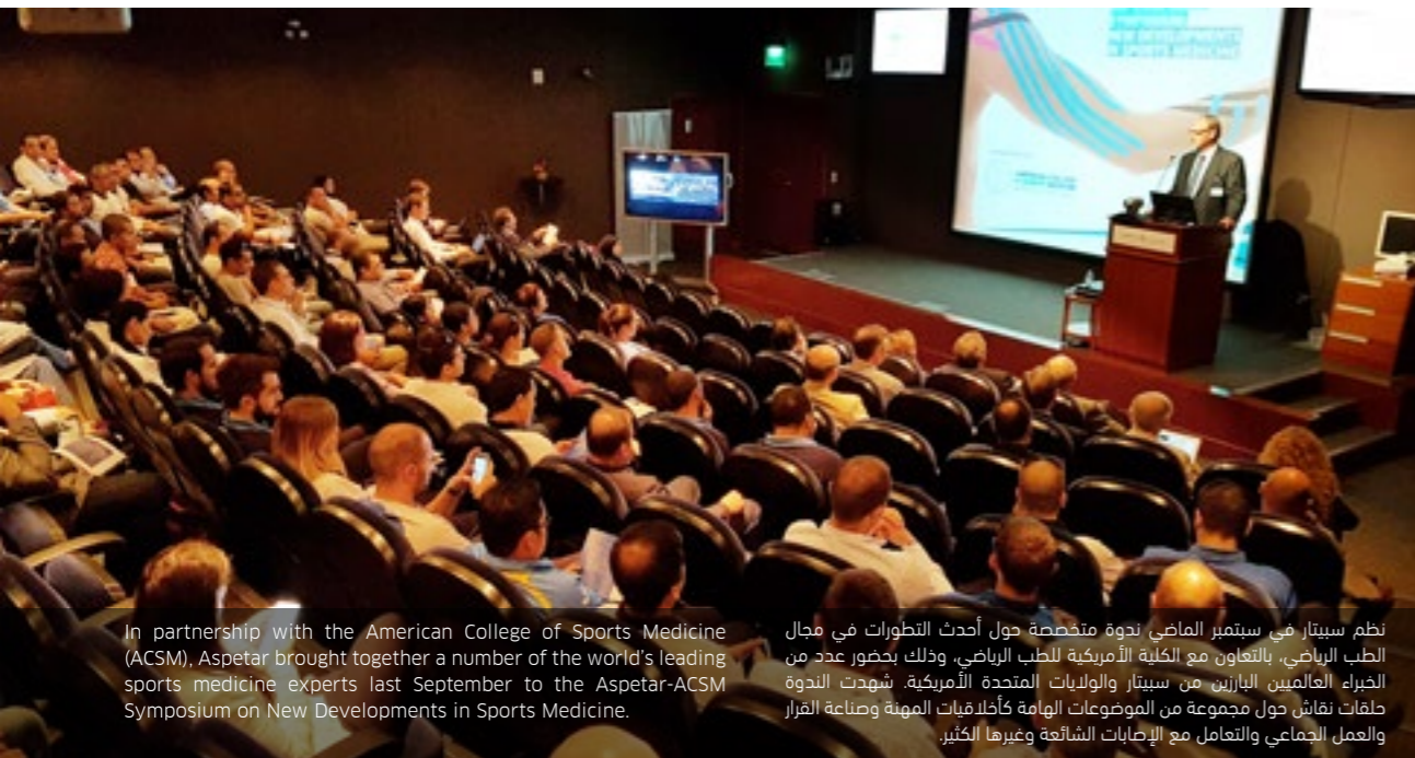
In partnership with the American College of Sports Medicine (ACSM), Aspetar brought together a number of the world's leading sports medicine experts last September to the Aspetar-ACSM Symposium on New Developments in Sports Medicine.