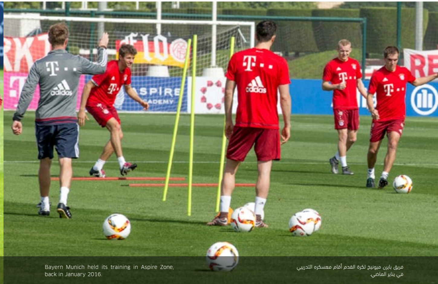
Bayern Munich held its training in Aspire Zone, back in January 2016.