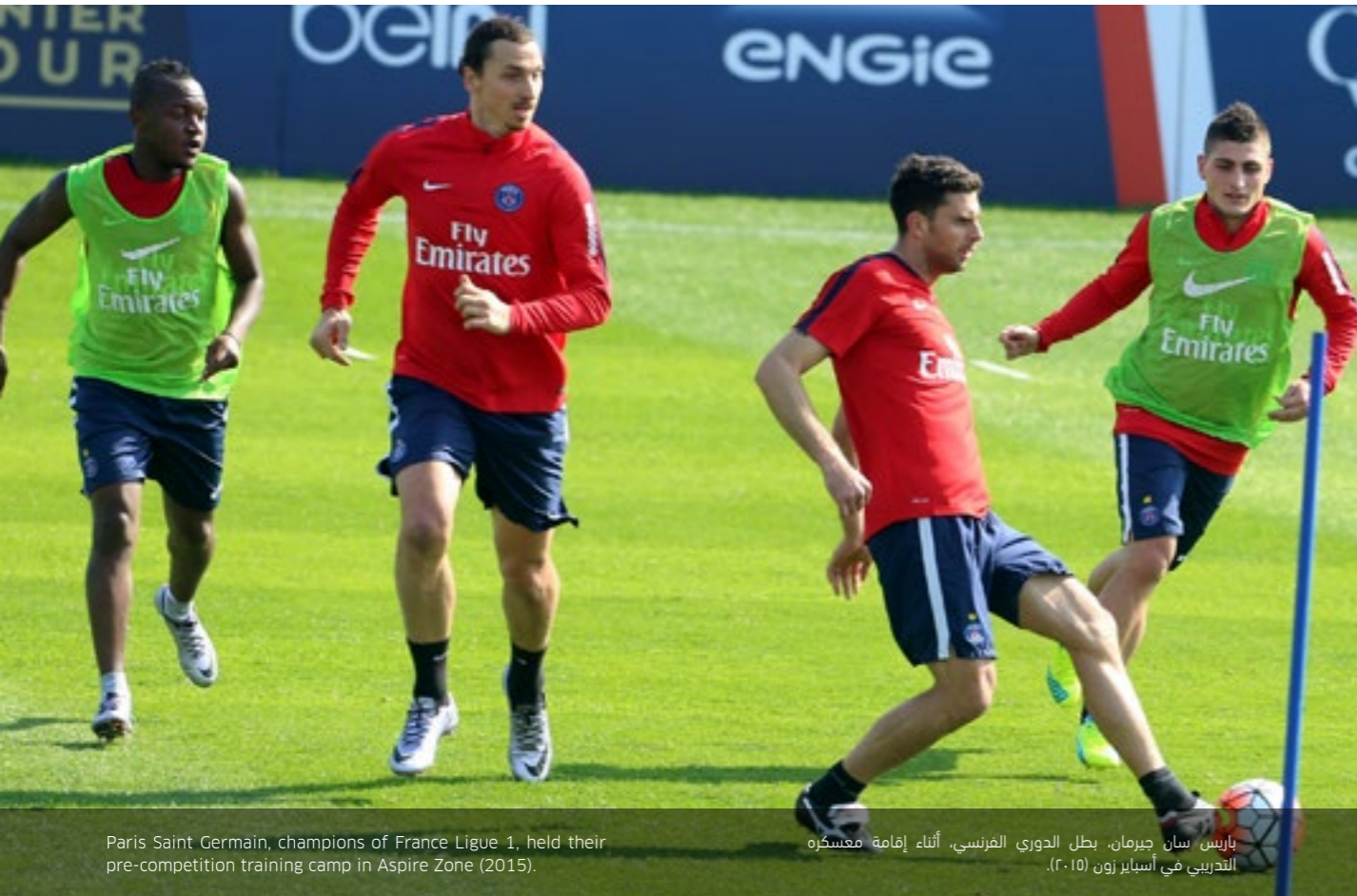
Paris Saint Germain, champions of France Ligue 1, held their pre-competition training camp in Aspire Zone (2015).