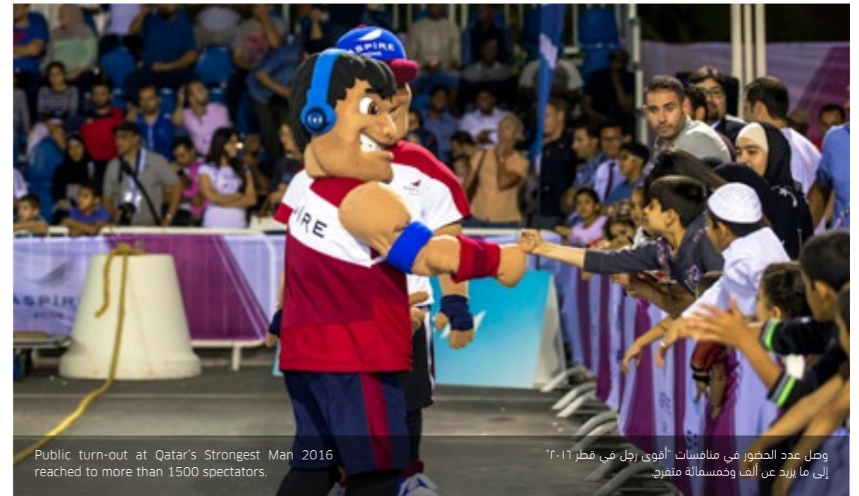
Public turn-out at Qatar's Strongest Man 2016 reached to more than 1500 spectators.