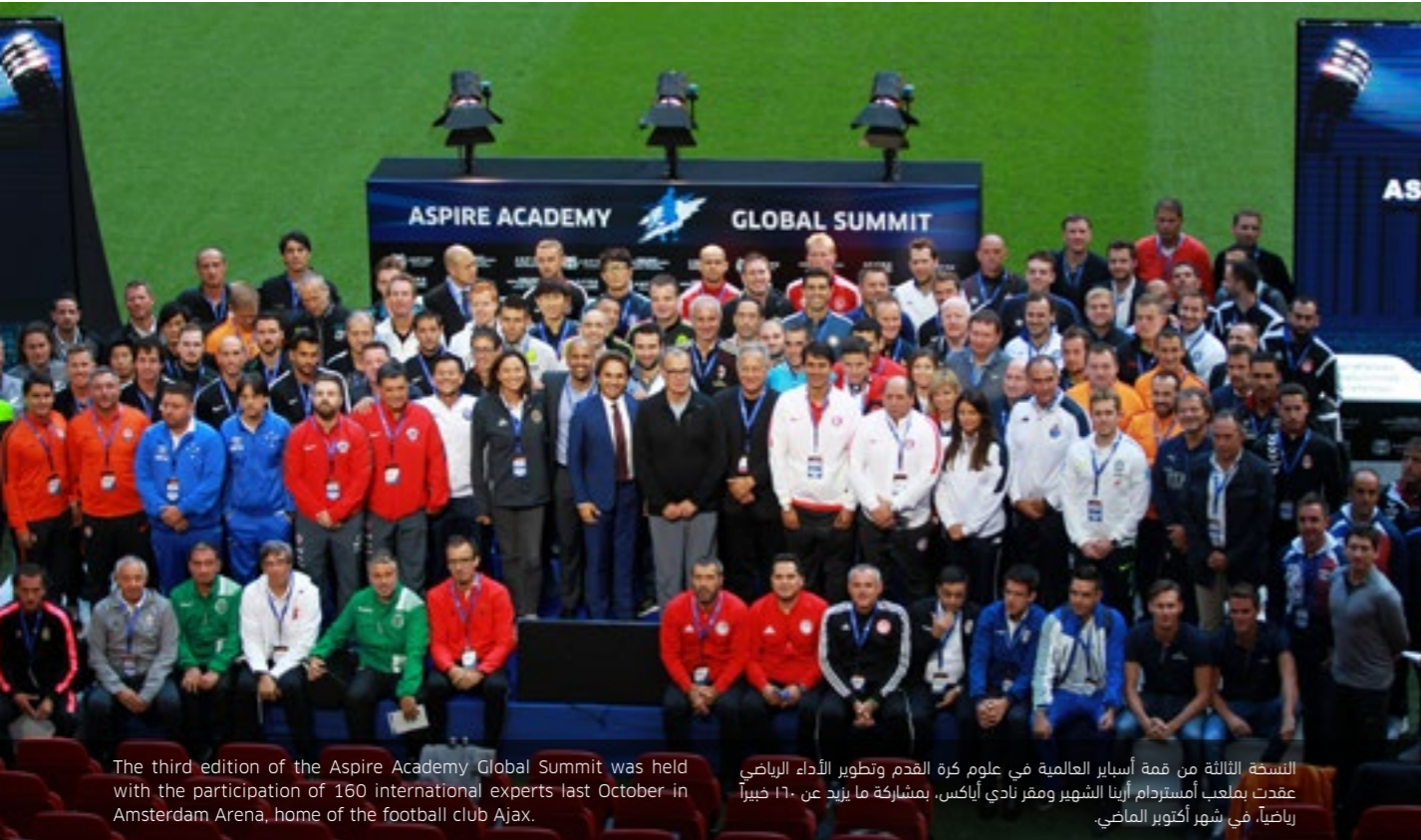
The third edition of the Aspire Academy Global Summit was held with the participation of 160 international experts last October in Amsterdam Arena, home of the football club Ajax.