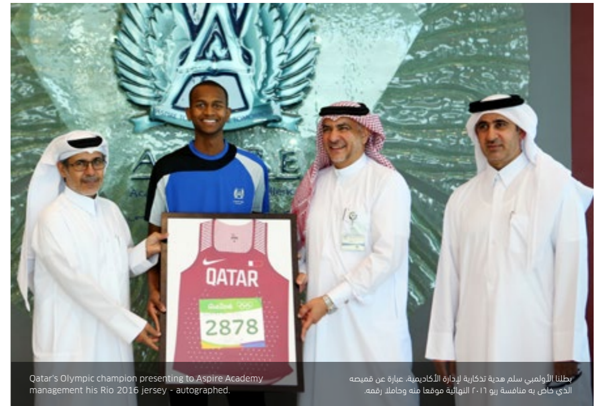
Qatar's Olympic champion presenting to Aspire Academy management his Rio 2016 jersey - autographed.